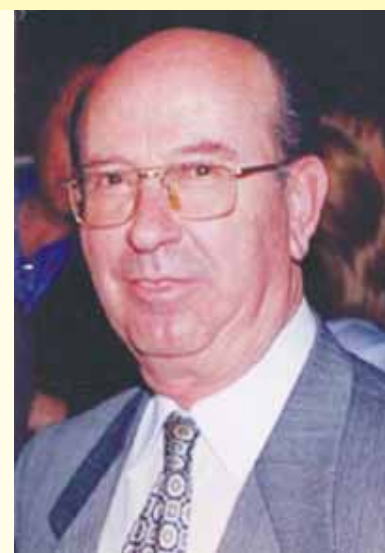
ΤΟΥ ΣΤΑΥΡΟΥ ΦΩΤΑΚΗ

Με λίγα λόγια, ποιος θα επιλεγεί από το κάθε κόμμα, που θα εξυπηρετεί πρωτίστως τα συμφέροντα του κόμματος και δευτερευόντως τα συμφέροντα των πολιτών. Αυτή είναι η καθαρή αλήθεια . Οι ισχυρισμοί περί “υπερκομματικών”, “ όλων των πολιτών”, κτλ., είναι παχιά λόγια , αγάπες και λουλούδια, ομορφοταιριασμένα παραμύθια όλων των υποψηφίων.